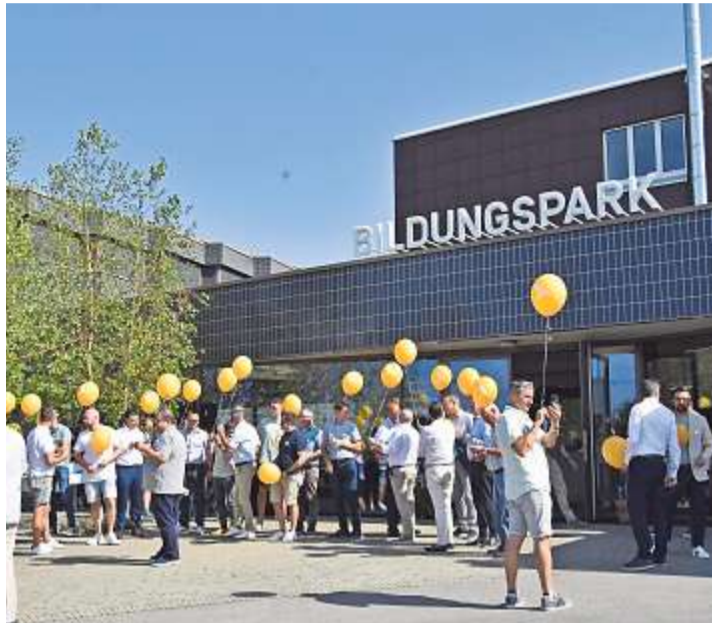
Der Bildungspark wurde feierlich eröffnet – er ist ein wichtiger Standort für Berufsleute in der ganzen Schweiz.

Neu absolvieren auf dem Areal rund 5000 Personen pro Jahr eine Aus- und Weiterbildung. Es sind zukünftige Berufsleute für die Baubranche oder das Kunsthandwerk, darunter etwa Plattenleger oder Steinmetzinnen. Fachleute für den Bootsbau kommen ebenfalls für Kurse hierher. Im neu erbauten Ausbildungszentrum Mittelland, direkt mit dem bestehenden Bildungspark verbunden, finden