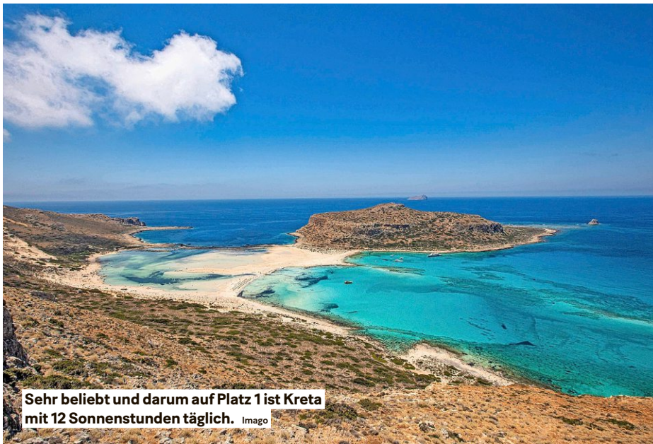
Sehr beliebt und darum auf Platz 1 ist Kreta mit 12 Sonnenstunden täglich.

BERN Neu dürfen gefährliche Arbeiten im Rahmen von Massnahmen zur Eingliederung in den Arbeitsmarkt auch von 15-Jährigen ausgeführt werden. Das hat der Bundesrat entschieden. Betriebe, die über eine entsprechende Bildungsbewilligung verfügen, sollen Jugendliche ab 15 Jahren unter strengen Voraussetzungen auch für gefährliche Arbeiten beschäftigen dürfen. FOS